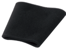
SLP251202 Foam Filter Filtro de Espuma 1-5 Gal.