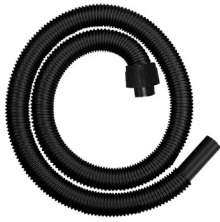
SLP251203 4' Hose Manguera de 4' 1-2 Gal.