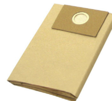
SLR251228 Disposable Filter Bag Filtro de Bolsa Desechable 2½-3½ Gal.