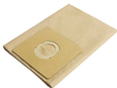
SLR131520 Disposable Filter Bag Filtro de Bolsa Desechable 10-12 Gal.