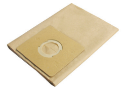
SLR131519 Disposable Filter Bag Filtro de Bolsa Desechable 6-8 Gal.