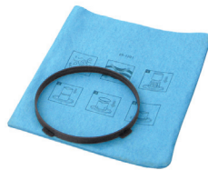
SLP251201 Reusable Dry Filter (with mounting ring) Filtro Seco Reutilizable (con el anillo de montaje) 1-5 Gal.