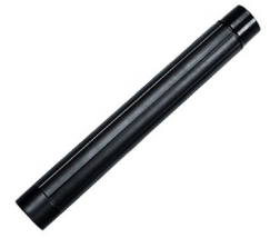
SLP082502 1.6' Extension Wands Vara de Extensión de 1.6' 14-18 Gal.