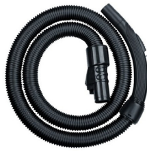
SLP131504 6.8' Hose Manguera de 6.8' 6-12 Gal.