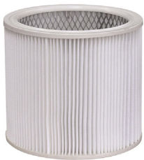
SLP082501 Cartridge Filter Filtro de Cartucho 7-18 Gal.