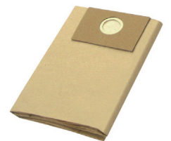
SLR251230 Disposable Filter Bag Filtro de Bolsa Desechable 4-5 Gal.