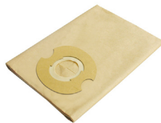
SLR131524 Disposable Filter Bag Filtro de Bolsa Desechable 10-12 Gal.