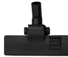
SLP131505 Floor Brush Cepillo de Piso 1-12 Gal.