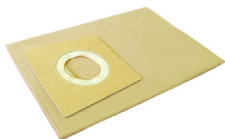
SLR082524 Disposable Filter Bag Filtro de Bolsa Desechable 14-18 Gal.