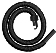
SLP251204 5' Hose Manguera de 5' 2½-5 Gal.